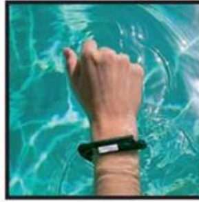
#UPbyJawbone Реально мотивирует!