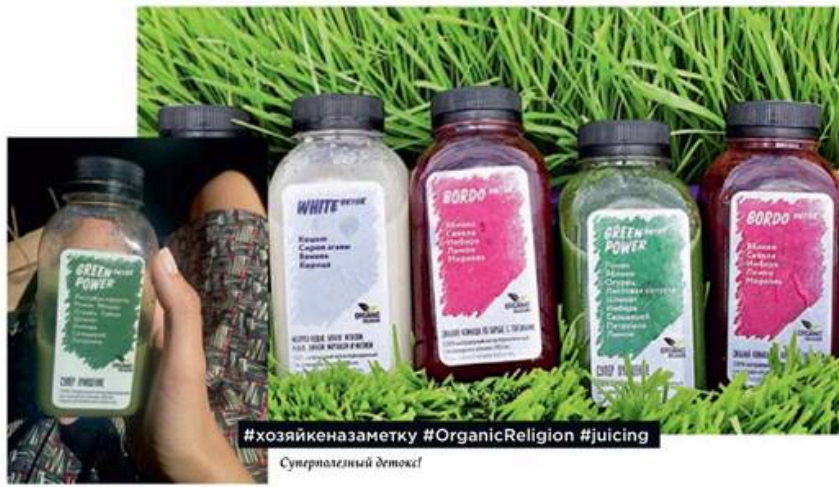
#хозяйкеназаметку #OrganicReligion #juicing Суперполезный детокс!